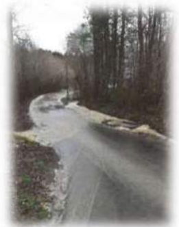
2020 - St Aubin des Coudrais

➔ Zoom sur la commune de St Aubin des Coudrais qui a été sujette à deux phénomènes d'inondation à caractères exceptionnels en 2018 et 2020.