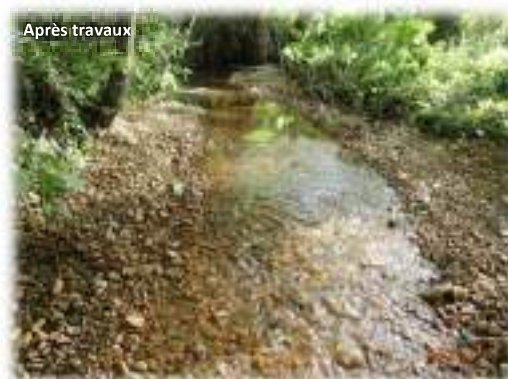
La Longuève à Dollon/Duneau