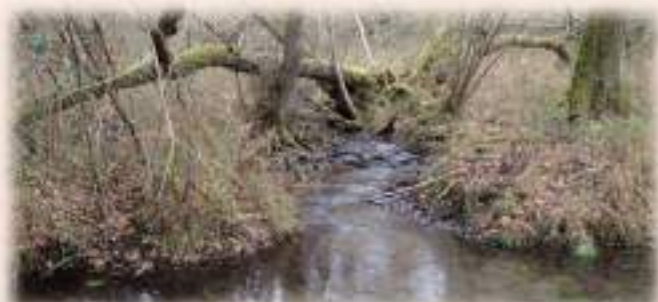
Cours d'eau non dégradé