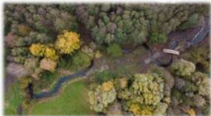
Remise en fond de vallée du Narais à Challes