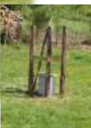
Mise en place d'un dispositif de suivi par le SBVHS, avec le soutien du CEN PdL, afin de suivre l'évolution de la nappe sur le bassin du Dué.

En 2022, Ce sont 4 kms de linéaire de cours d'eau restaurés pour un budget de 140 000 € TTC