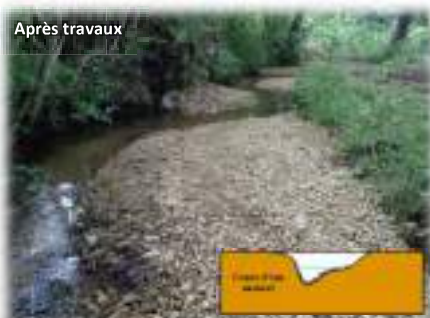
La Hune à Challes/Volnay